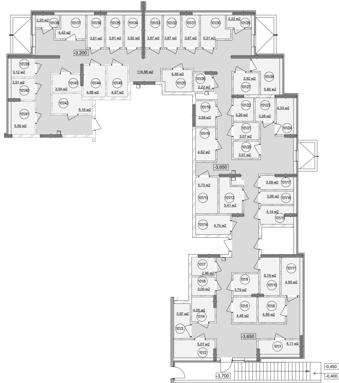
Схема генерального плану

Житловий будинок №1 Приміщення для зберігання велосипедів цокольного поверху