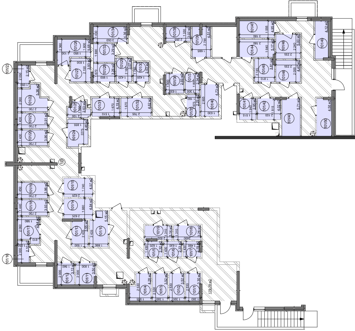
Схема генерального плану

Приміщення для зберігання велосипедів цокольного поверху