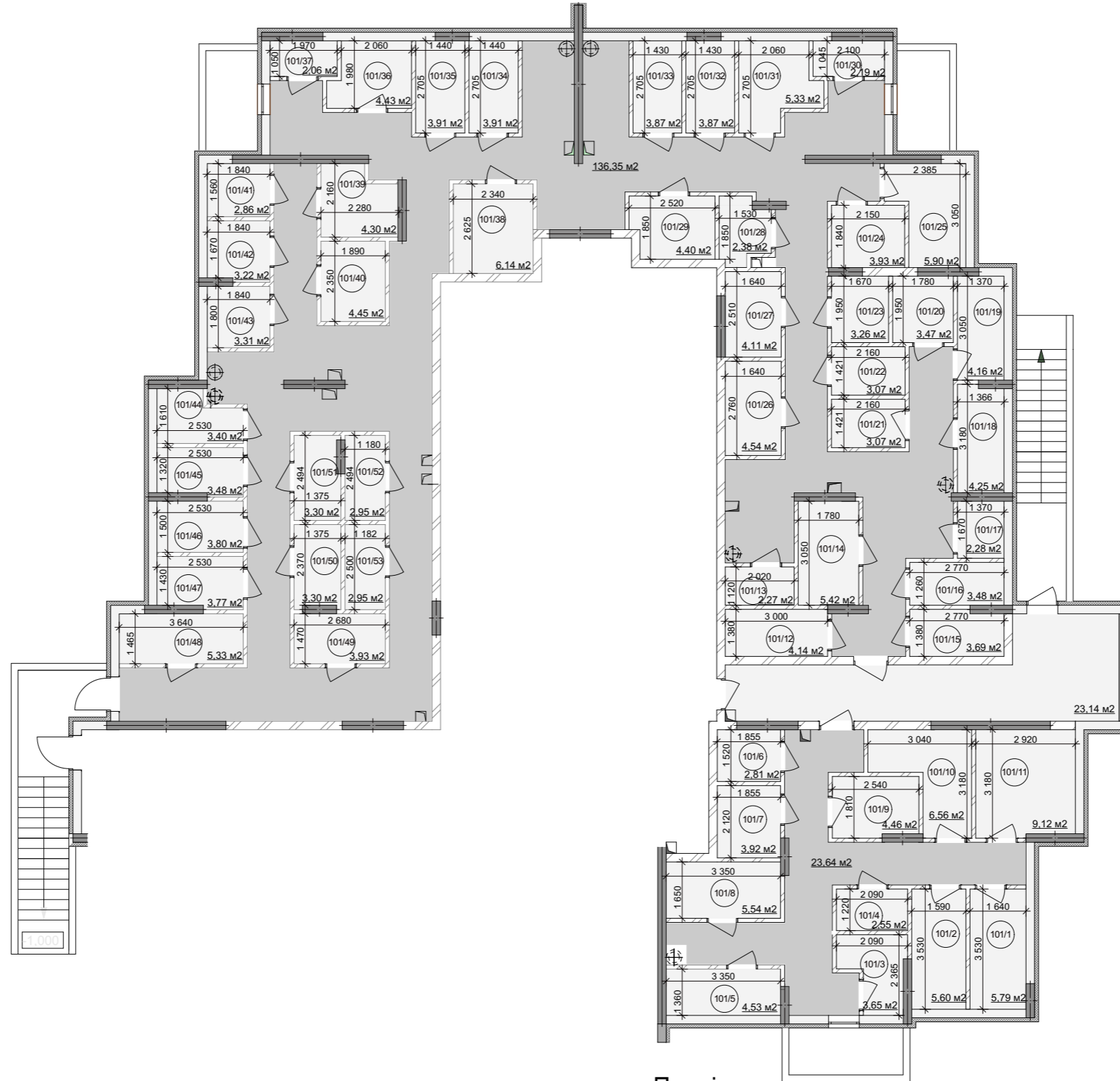
Схема генерального плану

Житловий будинок №3 Приміщення для зберігання велосипедів цокольного поверху